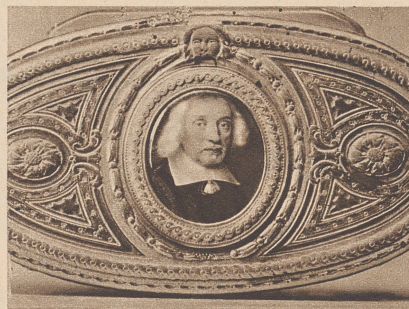
Der Miniaturmaler Jean Petitot (Selbstbildnis) Original im Musée d'Art et d'Histoire, Genève

Und nicht nur das Ihre. Wie oft hatte sie Jean veranlaßt, ihr von seinem Leben zu berichten, das bunt und ereignisreich gewesen war und ihn schon zu hohen Ehren geführt hatte, ehe sie sich noch kennengelernt hatten. Jeans Leben war ihr so vertraut, ihm nachzudenken, es