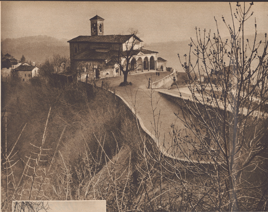
Beim Aufstieg schien das zierliche Glockentürmchen bescheiden und geduckt dem Pfarrhaus aufgesetzt zu sein, doch als wir, der Straßenlehre folgend, es von oben erblickten, wich wohlinnend friedlichem Anblick setzte es gleichsam die Spitze auf! Edle Harmonie strömt die Kirche von Salorino aus, und wer über ihren Wiesenplatz schreitet, fühlt sich weitab von Kriegslärm und Tagesorgen. La petite église de Salorino et sa terrasse vues d'un lacet de la route.