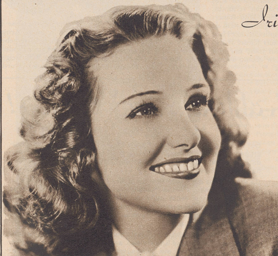
Lola Lane, Star of Warner Bros. Pictures, appearing in "Four Daughters".

Irium in Pepsodent Zahnpaste begeistert Millionen —