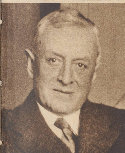
Fritz Thyssen der bekannte deutsche Großindus- trielle, der jahrelang den Nationa- lsozialismus finanziell unter- stützte, lebt jetzt in der Schweiz, nachdem sein Vermögen vom deutschen Staat beschlagnahmt worden ist.