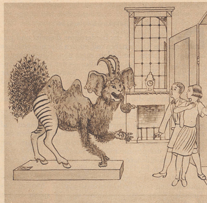
Gemeines Lügterier (chimaera vulgaris)

Ein grausiges Ungetüm starrte sie an. Noch nie hatten sie dergleichen gesehen, und fast wären sie vor Entsetzen umgefallen. Doch das Untier blieb reglos, und so atmete Otto auf und begann zu hoffen, es könnte ausgestopft sein. Und wirklich, so war es auch. Er trat kühn näher und entdeckte ein Täfelchen, auf dem geschrieben stand: