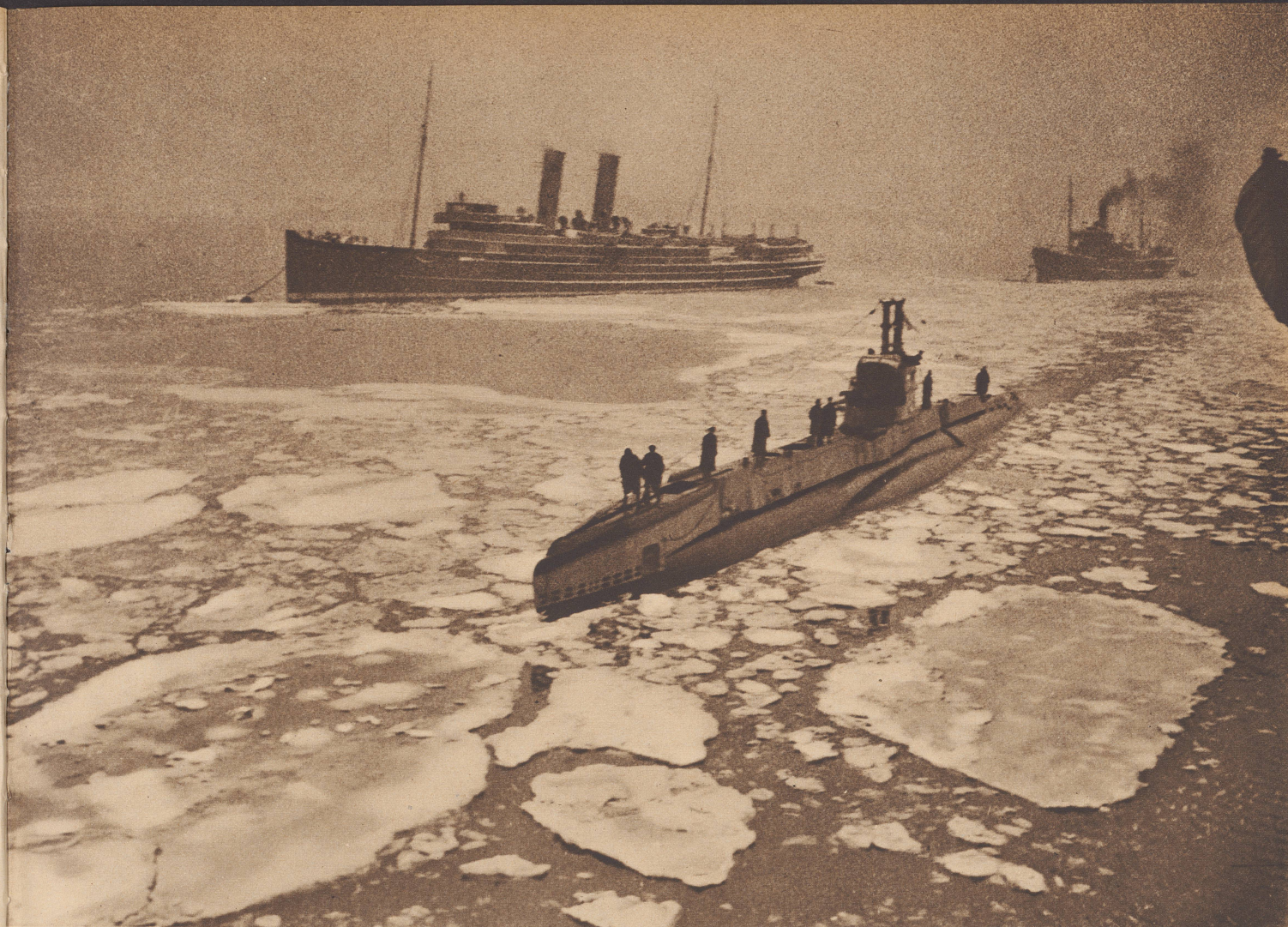
Kühler Empfang. Englisches Unterseeboot kehrt nach mehrtägiger Patrouillenfahrt in den Heimathafen zurück. Als es ausfuhr, war die See spiegelglatt und eisfrei, bei seiner Rückkehr vollzieht sich die Einfahrt in den Hafen bei großer Kälte und etwas behindert von mächtigen Treibeisfladen. Le retour d'un sous-marin anglais après une croisière de reconnaissance qui dura plusieurs jours. A son départ, la mer était calme comme de l'huile, à son retour, il trouve l'entrée du port obstruée par les glaces. On le voit ici se frayant un passage.