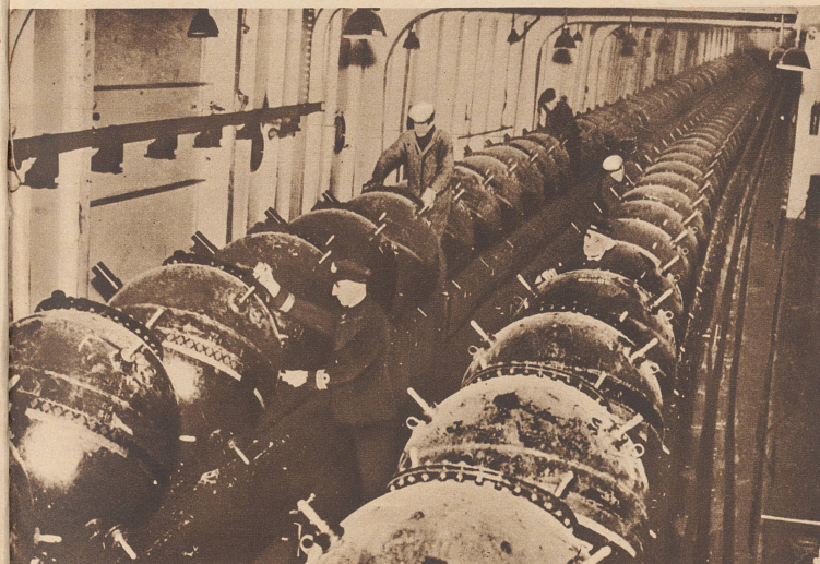
...und aufgereiht wie Perlen an der Schnur! Die Vorräte an Bord eines englischen Minenlegers, der den Auftrag hat, auf See, an einer Stelle vor Englands Küste, ein Sperr-Minenfeld zu legen.

Une tâche périlleuse. Voici, à bord d'un poseur de mines anglais chargé de la préparation d'un champ de mines, des centaines de mines marines prêtes à être descendues dans la mer.