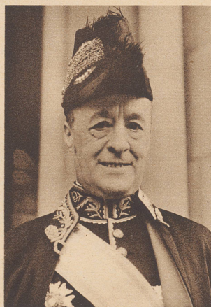
Exzellenz Domingo de las Barcenas

der neue spanische Gesandte bei der Eidgenossenschaft, hat dem Bundesrat sein Beglaubigungsschreiben überreicht.