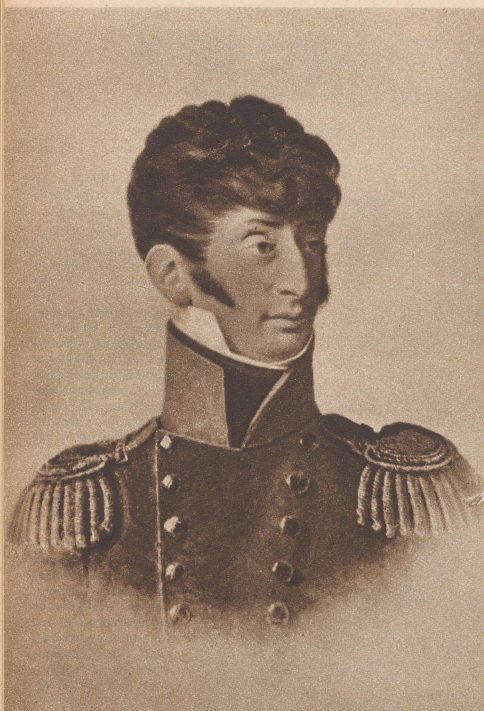
General Charles Jules Guiguer de Prangins (1780–1840)

Général Theodor Reding (1755-1809). Il est originaire d'une ancienne famille de Schwyz. Son frère Alois Reding, fut le héros de Schindellegi et de Rothenthurm. Il entre à 16 ans au service de l'Espagne et devient bientôt capitaine, dans le régiment qui porte son nom. Il se distingue, en 1793/94 contre les Français, couvre à Irun la retraite des Espagnols et se bat en 1800 dans la guerre de Portugal en qualité de général. En 1806 il est gouverneur de Malaga. Il gagne la bataille de Baylen sur les Français. Malaga l'accueille en triomphe. Il meurt en 1809 à la suite des blessures reçues à la bataille de Tarragone. Les Tarragonais élèvent un monument à sa mémoire.