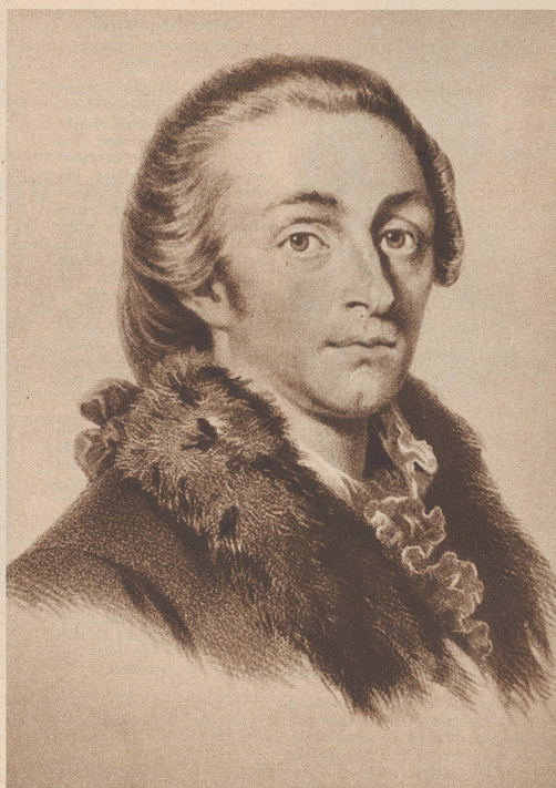
General Theodor Reding (1755–1809)