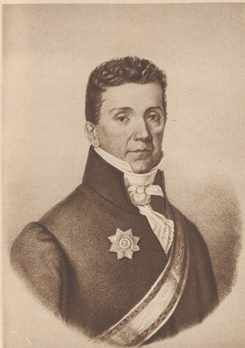
General Niklaus Rudolf von Wattenwyl (1760—1832)

Er entstammt einer der ältesten Berner Familien. Mit 17 Jahren steht er bereits als Fähnjonker in holländischen Diensten. 1783 kehrt er nach Bern zurück und zeichnet sich während der Schlacht bei Neuenegg (1798) als Kommandant des Fusilierbataillons des Regiments Thun aus. Während der Helvetik wird er Schultheiss von Bern, 1804 Landammann der Schweiz. 1805 ernannt ihn die Tagsatzung zum General und beauftragt ihn, die Grenze gegen Deutschland zu schützen. 1813 steht er wiederum an der Spitze der Eidgenössischen Armee, die das Land vor einem Einmarsch der Alliierten zu schützen hat. Eben ist er von einer Krankheit genesen und noch tief erschüttert durch den Tod seines Sohnes Albert, doch er schreibt an die Tagsatzung: «Die Existenz der Nation zu retten, ist das höchste Ziel, das man im Auge haben muß; alles andere ist Nebensache.»