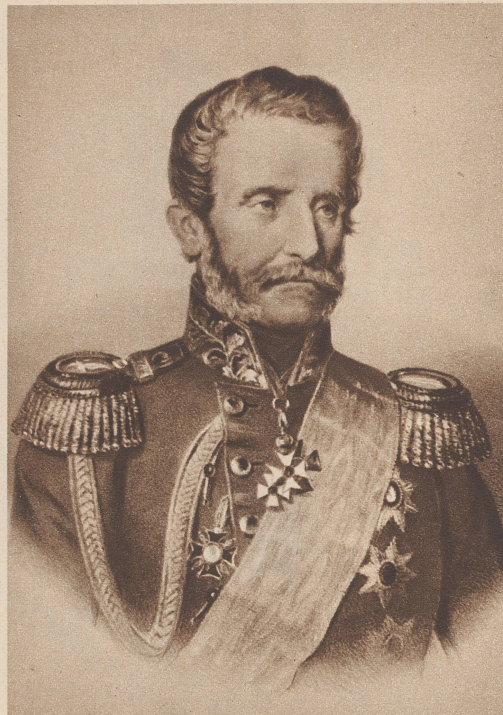
General Anton Heinrich Jomini (1779—1869)