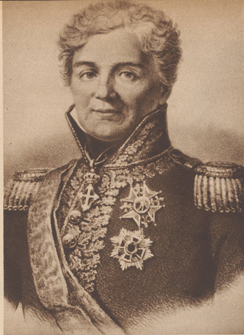
General Freiherr Franz Niklaus Bachmann (1740-1831)

Général Friedrich Freiherr von Hotze (1739-1799). Il naquit à Richterswil. Son nom est Johann Konrad Hotz. Plus tard ses succès militaires lui valent titre et honneurs. Il passe du service wurtembergeois à celui de la Russie et se bat contre les Turcs sous les ordres de Souworow. Au service de l'Empereur Joseph II d'Autriche, il lutte contre les Français. Après la paix de Campoformio il prend sa retraite. A son retour en Suisse il trouve celle-ci occupée par les troupes napoléoniennes. L'Archiduc Charles le nomme commandant des troupes des Grisons. Une balle l'atteint mortellement, lors de la victoire de Zurich, le 4 juin 1799.