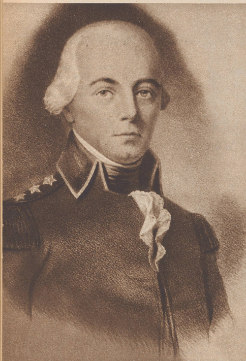
General Johannes Weber (1752–1799)

Er stammt aus dem bernischen Seeland (geboren in Brüttelen bei Ins). Zunächst dient er als gemeiner Soldat im Berner Regiment der niederländischen Generalstaaten. Sein soldatisches Können bringt ihn vorwärts. Er wird Brigademajor, dann Adjutant des Prinzen von Oranien. 1798 wird er in der Heimat Generaladjutant im Generalstab von Erlachs. Am 5. März führt er die Berner zum Sieg von Neueneegg. Während der Helvetik wird er Kommandant der 1. Halbbrigade der helvetischen Legion. Er starb als Oberbefehlshaber der helvetischen Truppen im Kampf gegen die Oesterreicher bei Frauenfeld, nachdem er am Tage zuvor vom helvetischen Direktorium zum General ernannt worden war.