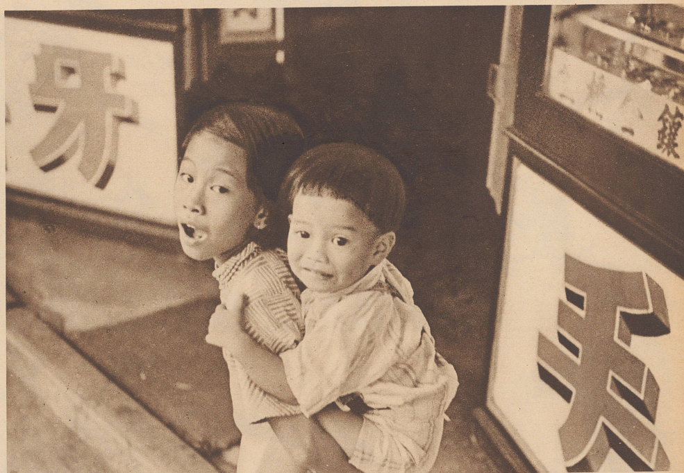
Zwei angsterfüllte Chinesenkinder.