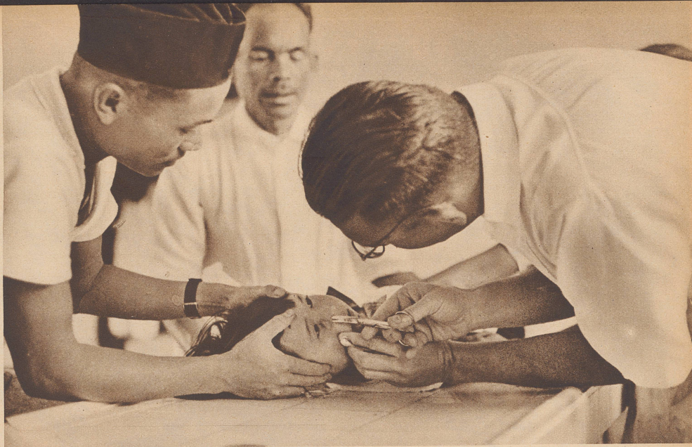
Ein tapferes Chinesenmädchen.

Der Kirchenrechtslehrer August Neander erfreute seine Zeitgenossen durch seine beispiellose Zerstreutheit. Einmal fiel ihm plötzlich während einer Vorlesung ein, er habe seine Uhr zu Hause liegen lassen. Er bat einen Studenten um die Freundlichkeit, sie ihm zu holen. Als der Student aufsprang, um sich zu entfernen, zog Neander die Uhr aus der Tasche und sagte ernsthaft: «Es ist gerade neun Uhr, wenn Sie sich beeilen, können Sie also um halb zehn wieder hier sein.»