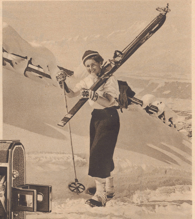
Meisteraufnahmen durch diese drei: Zeiss Ikon Camera, Zeiss Objektiv, Zeiss Ikon Film