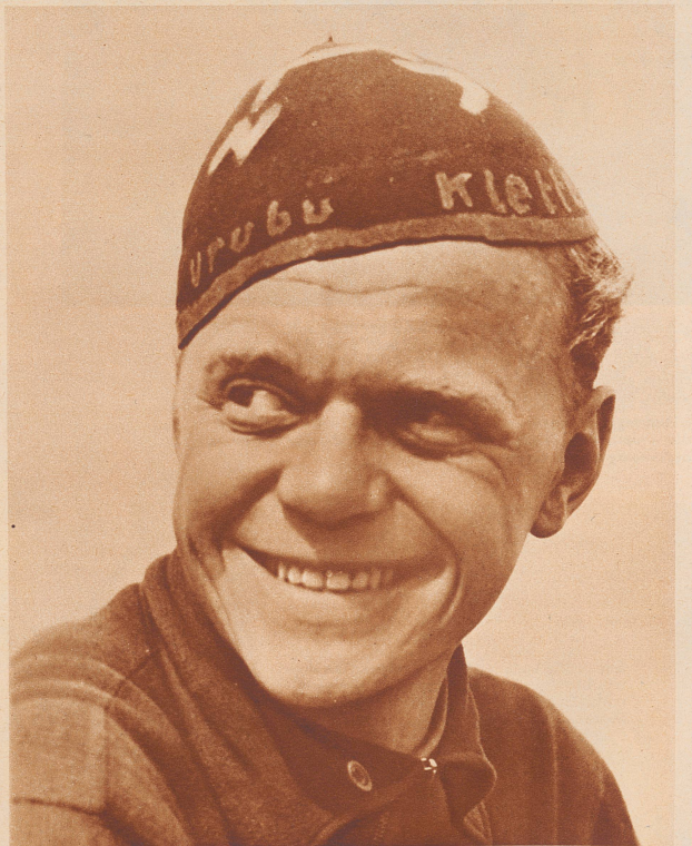
Das Gesicht eines Studenten der Ingenieurwissenschaft und Reservoffiziers der finnischen Armee. Auf seiner Sportmütze stehen zwei Worte: «Urubu» und «Klettermax». Das sind die Namen berühmter deutscher Segelflugmaschinen, hingeschrieben aus Schwärmerei und Begeisterung. Das Bild ist zwei Jahre alt, die Zeiten haben sich inzwischen geändert.

Dans les trams d'Helsinki on rencontre presque uniquement des recevenses. Les femmes de Finlande jouissent d'une réputation mondiale. En 1918, des bataillons féminins luttèrent aux côtés des hommes contre les bolchevistes.