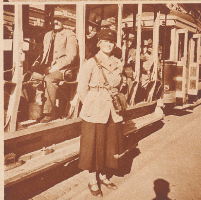
Trambahnfrau in Helsinki. Weibliche Schaffnerinnen sind die Regel. Finnlands Frauen genießen hohes Ansehen daheim und draußen in der Welt. Im Befreiungskampf von 1918 gegen die Bolschewiken standen Frauenbataillone den Männern zur Seite. Auf allen Gebieten des Lebens stand Finnland in der Vorhut der Frauenbewegung.

Dans l'intérieur de la Finlande: La ville de Kuopio sur les rives du lac Saima. Ce fiacre conduisait les voyageurs au bateau. Mais l'hiver est venu amenant la guerre et la détresse.