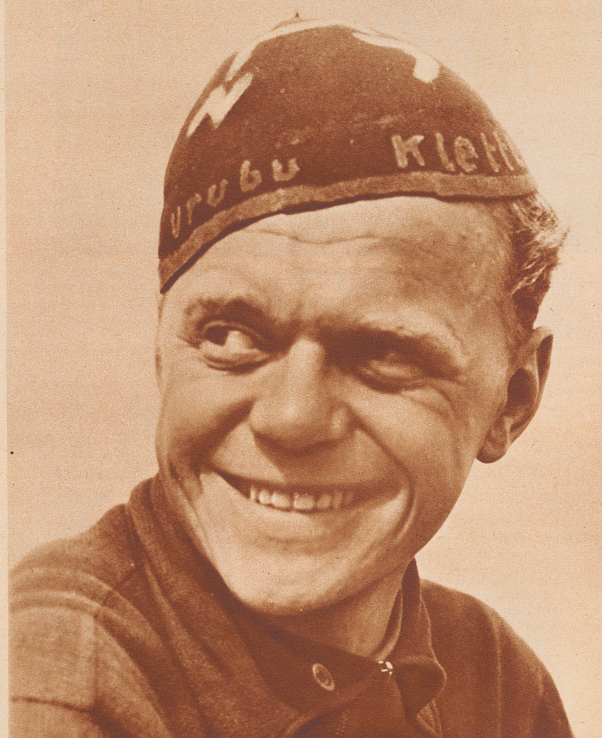
Das Gesicht eines Studenten der Ingenieurwissenschaft und Reserveoffiziers der finnischen Armee. Auf seiner Sportmütze stehen zwei Worte: «Urubu» und «Klettermax». Das sind die Namen berühmter deutscher Segelflugmaschinen, hingeschrieben aus Schwärmerei und Begeisterung. Das Bild ist zwei Jahre alt, die Zeiten haben sich inzwischen geändert.

Dans les trams d'Helsinki on rencontre presque uniquement des receveuses. Les femmes de Finlande jouissent d'une réputation mondiale. En 1918, des bataillons féminins luttèrent aux côtés des hommes contre les bolchevistes.