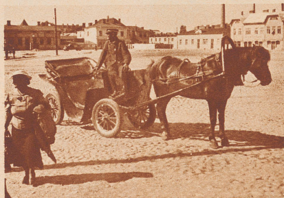
Im Innern Finnlands: die Stadt Kuopio am Saima-See. Eine Pferdedroschke, drin die Reisenden zur Schiffslände fahren konnten. Jetzt ist da Winter, Kummer, Krieg und ein Jammer unter Frauen und Kindern.

Dans l'intérieur de la Finlande: La ville de Kuopio sur les rives du lac Saima. Ce fiacre conduisait les voyageurs au bateau. Mais l'hiver est venu amenant la guerre et la détresse.