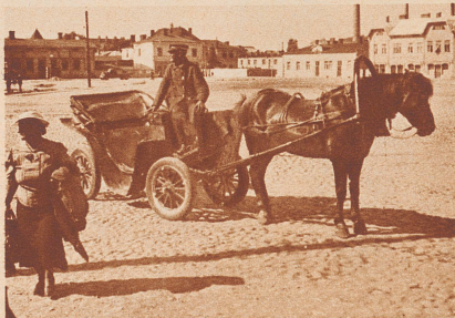
Im Innern Finnlands: die Stadt Kuopio am Saima-See. Eine Pferdewagen, drin die Reisenden zur Schiffslände fahren konnten. Jetzt ist da Winter, Kummer, Krieg und ein Jammer unter Frauen und Kindern.

Dans l'intérieur de la Finlande: La ville de Kuopio sur les rives du lac Saima. Ce fiacre conduisait les voyageurs au bateau. Mais l'hiver est venu amenant la guerre et la détresse.