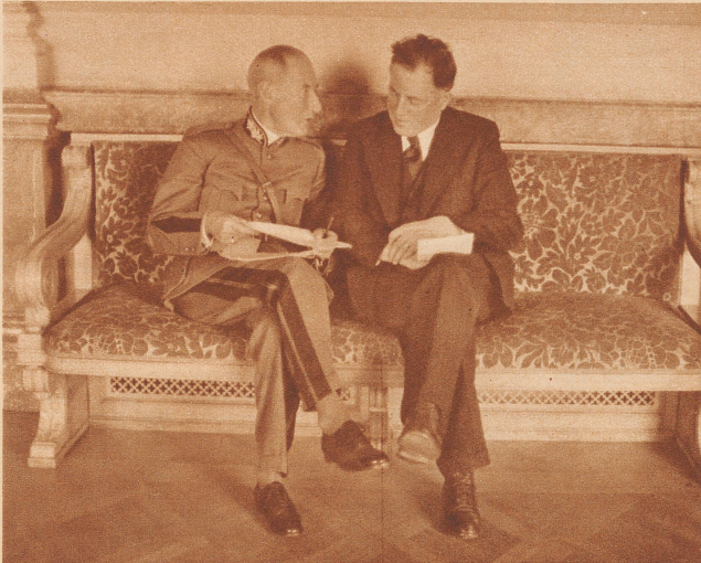
Nationalrat R. Dollfus (K.-K.), Tessin, Oberstdivisionär, Generaladjutant der Armee, im Gespräch mit Nationalrat Perret (Neuenburg) in der Wandelhalle des Bundeshauses.

zusammen aus 50 Radikaldemokraten, 45 Sozialdemokraten, 44 Katholisch-Konservativen, 21 Bauernparteilern, 6 Liberal-Konservativen, 9 Unabhängigen, 6 Freien Demokraten, 4 Dissidenten Sozialdemokraten, einem Demokraten und einem Freiwirtschaftler; zusammen 187 Mitglieder. Ueber 50 davon bekleiden in der Armee einen Offiziersgrad. Hier sind sie alle im Bild festgehalten.