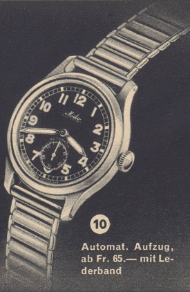
10 Automat. Aufzug, ab Fr. 65.— mit Lederband