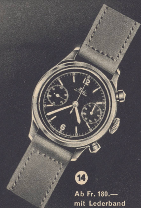
14 Ab Fr. 180.— mit Lederband

Modell Nr. 10 ist ferner mit dem automatischen Aufzug ausgerüstet. Diese Uhr wird durch die natürlichen Armbewegungen aufgezogen und hat nach 3–5 stündigem Tragen eine Gangreserve von ca. 32 Stunden.