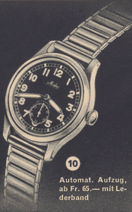
10 Automat. Aufzug, ab Fr. 65.— mit Lederband