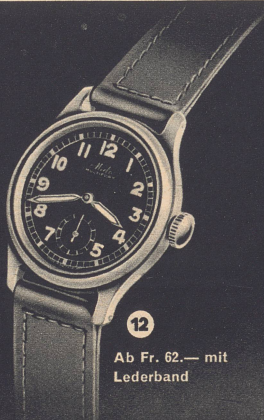
12 Ab Fr. 62.— mit Lederband