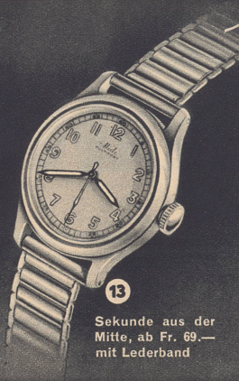
13 Sekunde aus der Mitte, ab Fr. 69.— mit Lederband