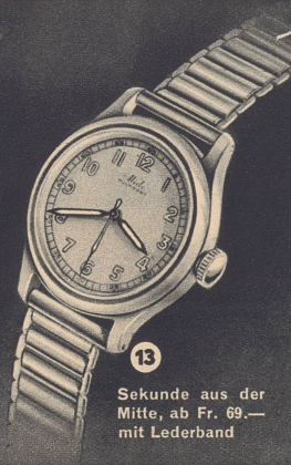
13 Sekunde aus der Mitte, ab Fr. 69.— mit Lederband