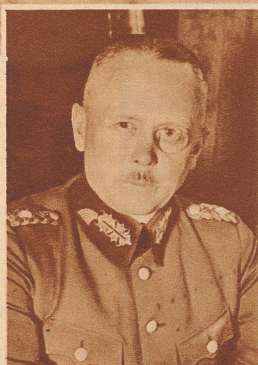
Generaloberst von Fritsch

der ehemalige Oberbefehlshaber des deutschen Heeres, ist am 22. September vor Warschau gefallen.