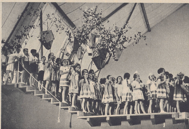
Aargau: Der 25. August war Kantonaltag der Aargauer. Sie kamen ohne Umzug, dafür mit dem wunderschönen Festspiel «O userwelte Eidgenossenschaft», woraus wir das reizende Kinderbild festgehalten haben.

Argovie. Le 25 août, lors de leur journée cantonale, les Argoviens ne firent pas de cortège. Un charmant groupe de fillettes d'Argovie, dans la Halle des fêtes.