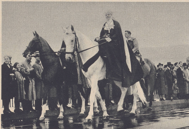
Glarus: Hoch zu Roß die Aebtissin von Säkingen im farbenprächtigen historischen Festzug der Glarner am 6. August 1939. Glaris. Au milieu des riches couleurs du cortège glaronais, le 6 août 1939, la gracieuse abbesse de Säkingen.