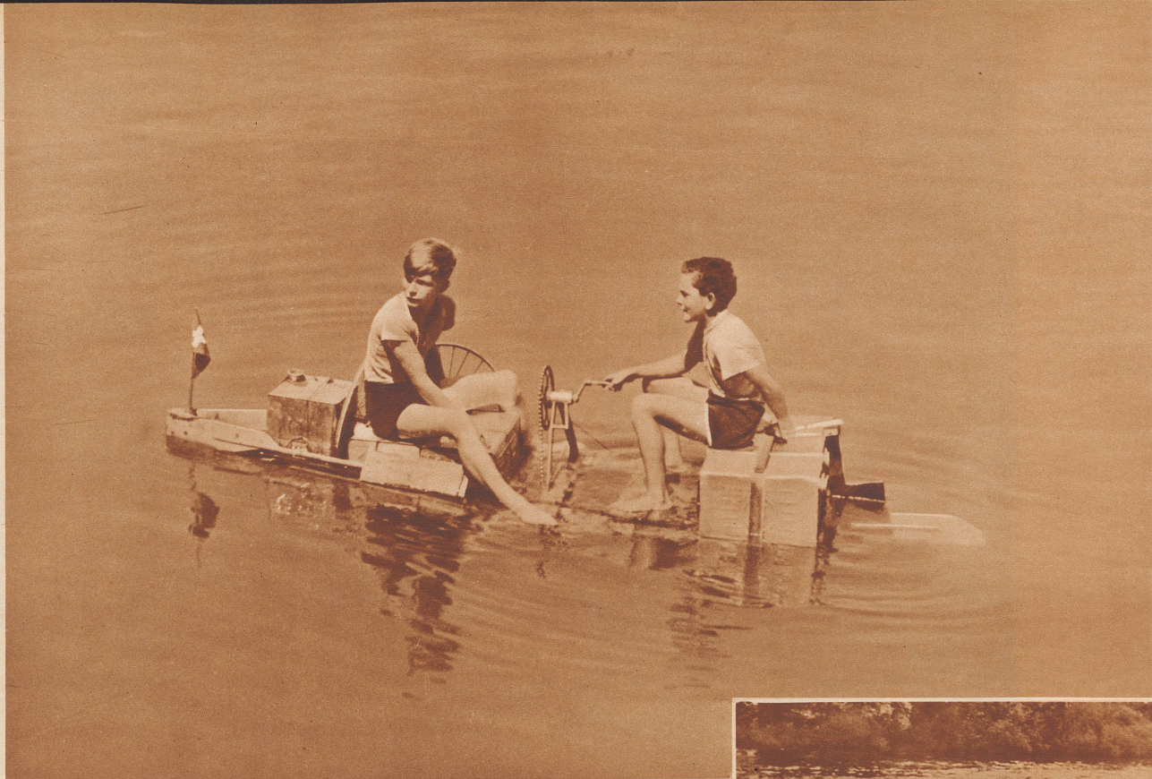
Zwei tüchtige Schiffbauer mit ihrem Schraubendampfer.