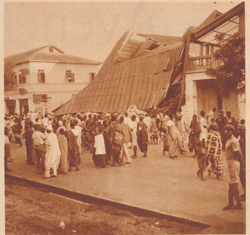
Nachricht aus Accra

Léopold III., Roi des Belges, salue les pilotes militaires suisses, les capitaines Schlegel et Thiébaud et le premier-lieutenant de Pourtales, qui prirent part les 8 et 9 juillet au meeting international d'aviation de Bruxelles.