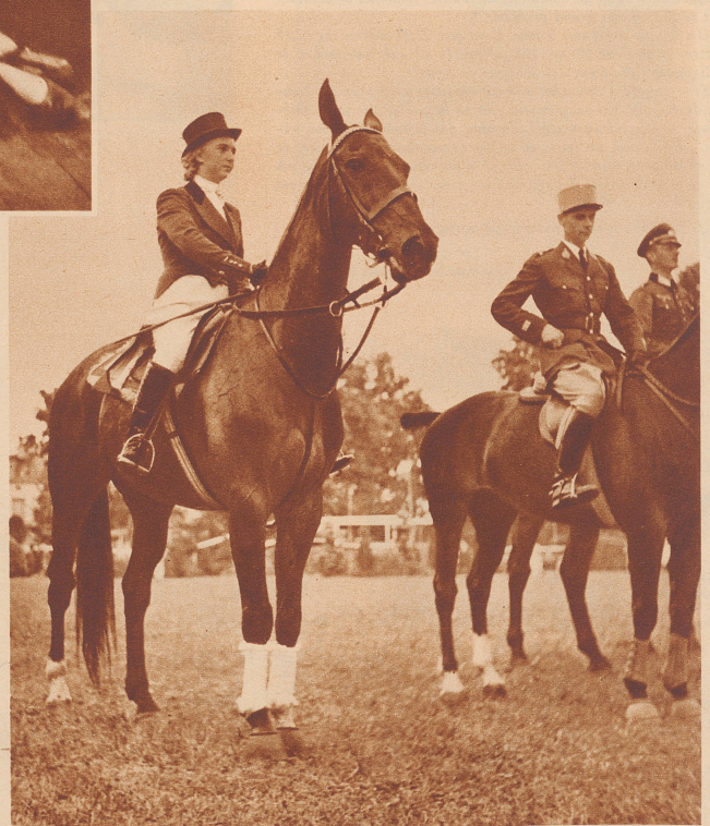
Eine Amazone schlägt die Springreiter-Elite des ganzen Kontinentes

Le 22 juin, la ville d'Accra (Côte-d'Or) a été dévastée par un tremblement de terre, qui a causé de nombreuses victimes. une des nombreuses maisons démolies dans le centre de la ville et groupes d'indigènes, très agités par le séisme.