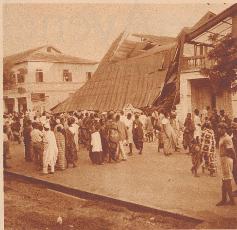
Nachricht aus Accra

Léopold III, Roi des Belges, salue les pilotes militaires suisses, les capitaines Schlegel et Thiébaud et le premier-lieutenant de Pourtalès, qui prirent part les 8 et 9 juillet au meeting international d'aviation de Bruxelles.