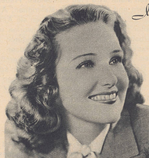
Lola Lane, Star of Warner Bros. Pictures, appearing in "Four Daughters".

Irium in Pepsodent Zahnpaste begeistert Millionen — jeden Morgen erneut — durch das neue blendende Weiss, das es den Zähnen verleiht! Nie zuvor konnte solch strahlender Glanz mit einer so absolut unschädlichen Zahnpaste erzielt werden. Ja, mit IRIUM-haltigem Pepsodent riskieren Sie nichts . . . keine Möglichkeit, dass Ihr kostbarer Zahnschmelz angegriffen wird.