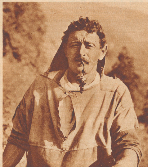
Charakterkopf eines Bauern aus Mollis.

Vue du Kerenzerberg (canton de Glaris) sur la rive droite du lac de Wallenstadt.