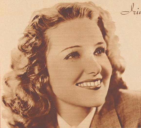
Lola Lane, Star of Warner Bros. Pictures, appearing in "Four Daughters".

Irium in Pepsodent Zahnpaste begeistert Millionen —