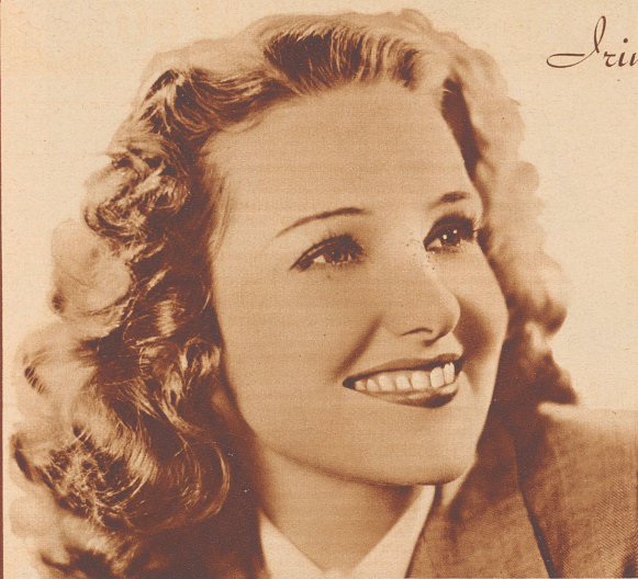
Lola Lane, Star of Warner Bros. Pictures, appearing in "Four Daughters".

Irium in Pepsodent Zahnpaste begeistert Millionen —