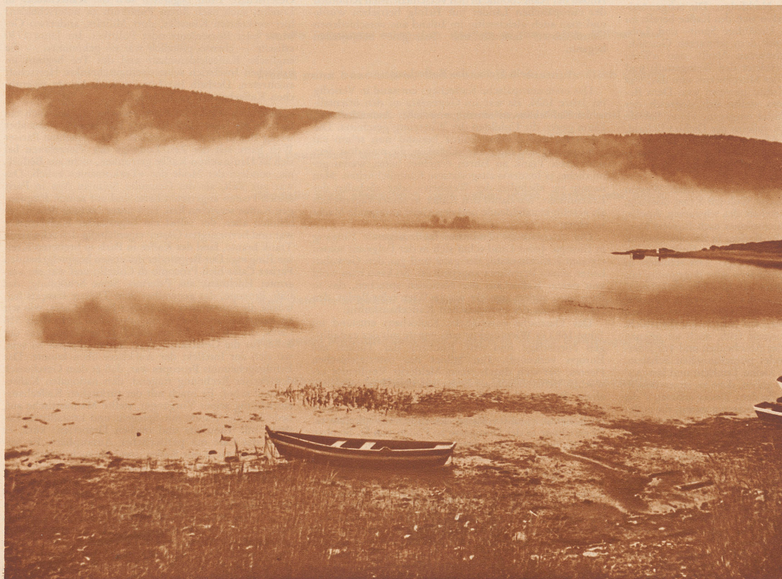
Neblicher Morgen am Lac de Joux. Im Hintergrund die Kette des Mont Tendre.