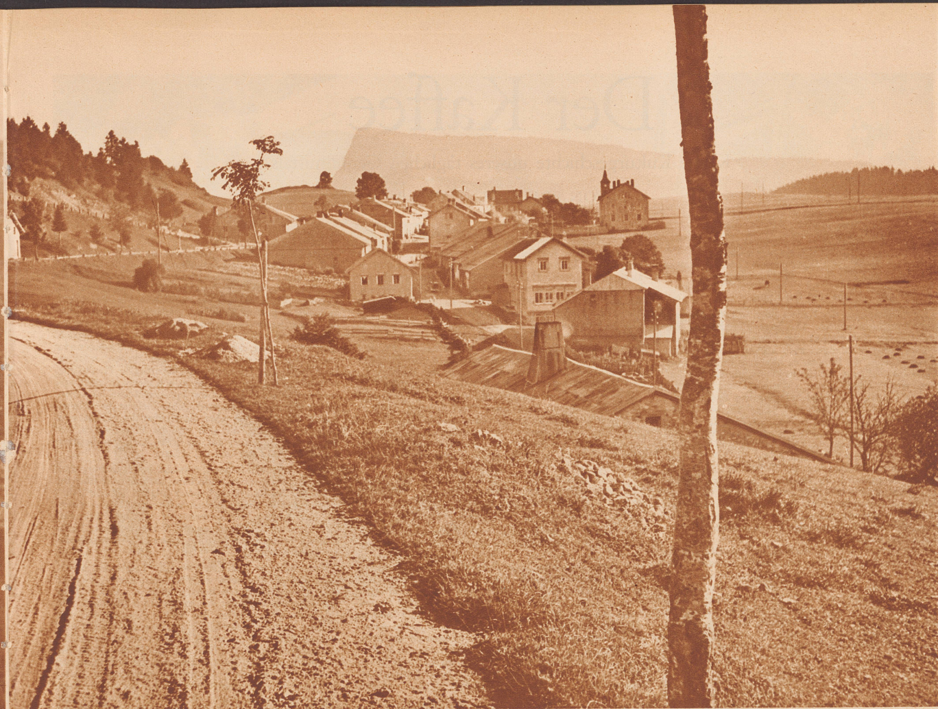
Le Séchey am Lac de Joux mit der Dent de Vaulion.