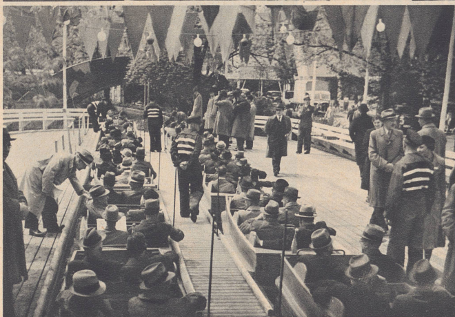
Die Einsteigestation des Schifflibaches. Hier herrscht Bahnhofsbetrieb. Am ersten Ausstellungssonntag fuhren zehntausend Menschen den Bach hinunter.