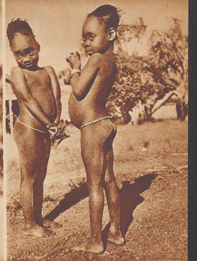
Ja, wir wagen es einmal!