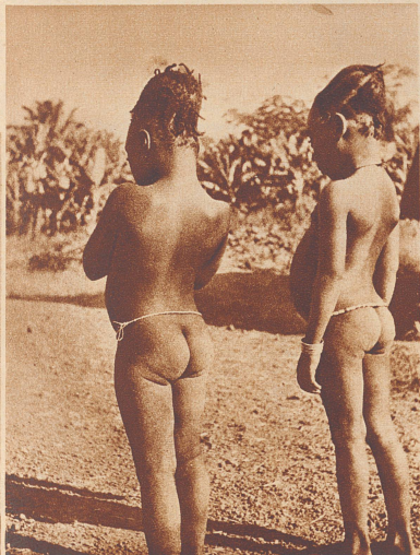
Zwei kleine afrikanische Mädchen zeigen der Kamera den Rücken.

Der Schöpfer des Filmes «La grande illusion», Jean Renoir, hat sich an Zolas Roman «La bête humaine» herangewagt. Das Wagnis glückte, und ein Werk kam zustande, das die künstlerische Sonderstellung des französischen Filmes wieder einmal überzeugend dartut. Der ungewöhnliche Film ist gegenwärtig in Zürich zu sehen. Bild: Jean Gabin als Mechaniker Jacques Lantier auf seiner Lokomotive. «La bête humaine». Le remarquable film que Jean Renoir vient de tirer du roman de Zola, passe actuellement à Zurich. On voit ici Jean Gabin qui incarne le mécanicien Jacques Lantier.