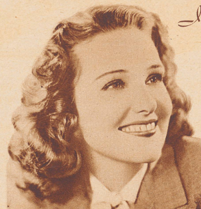
Lola Lane, Star of Warner Bros. Pictures, appearing in "Four Daughters".

Irium in Pepsodent Zahnpaste begeistert Millionen — jeden Morgen erneut — durch das neue blendende Weiss, das es den Zähnen verleiht! Nie zuvor konnte solch strahlender Glanz mit einer so absolut unschädlichen Zahnpaste erzielt werden. Ja, mit IRIUM-haltigem Pepsodent riskieren Sie nichts... keine Möglichkeit, dass Ihr kostbarer Zahnschmelz angegriffen wird.