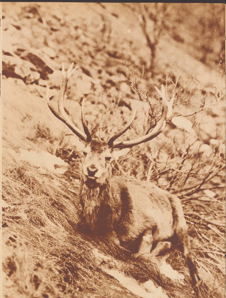
Wintermüder Hirsch im Sonnenbad des Frühlings