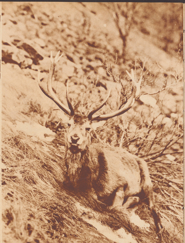
Wintermüder Hirsch im Sonnenbad des Frühlings