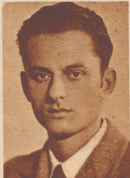
Nicolas Rossolimo (Griechenland) der Sieger des Turniers.