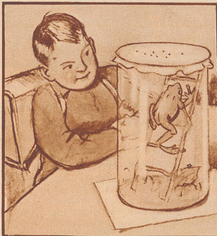
„Ach was, eben sass er noch unten, jetzt oben, was gilt nun?“

«Ob das ein Glück ist, muß man erst abwarten», sagte Lore und legte ihren Kopf an seine Brust.