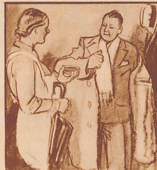
Er: „... Schnupfenwetter!“ Sie: „Nicht so schlimm, vor allem Deine Gaba nicht vergessen, die beugen vor!“