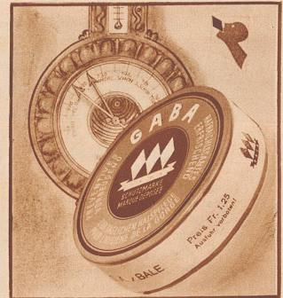
Wie steht der Barometer? Auf Gaba steht er.