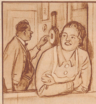
Er: „Wer hat schon wieder den Barometer verstellt?“ Sie: „Niemand, Vati, es ist eben Aprilwetter.“