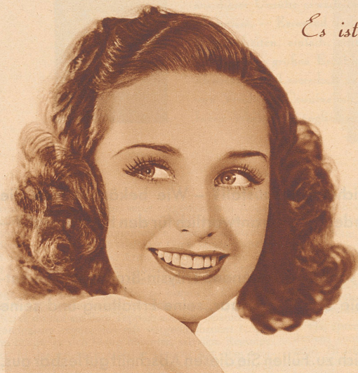
Rosemary Lane, Star of Warner Bros. Pictures, appearing in "Four Daughters".

Es ist eine wahre Freude, sich die Zähne mit IRIUM-haltigem Pepsodent zu reinigen. Sobald es die Zähne berührt, fühlen Sie die angenehme Wirkung seines belebenden, erfrischenden Schaumes. Und welch wohligh prickelndes Gefühl der Frische bleibt in Ihrem Munde zurück! Doch der grösste Beweis... Schauen Sie in den Spiegel, wenn Sie eine Überraschung haben wollen. Sie werden erstaunt sein über den neuen, reizvollen Glanz Ihrer Zähne. Nur Pepsodent Zahnpaste kann solch blendendes Weiss hervorbringen. Denn Pepsodent enthält Irium, die hervorragende Entdeckung mit der erstaunlichen Reinigungskraft. Beginnen Sie noch heute mit der Pepsodent-Zahnpflege.