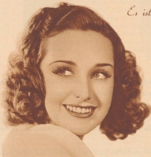
Rosemary Lane, Star of Warner Bros. Pictures, appearing in "Four Daughters".

Es ist eine wahre Freude, sich die Zähne mit IRIUM-haltigem Pepsodent