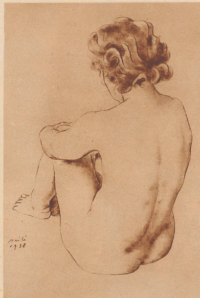
Weibliche Gestalt — Nu