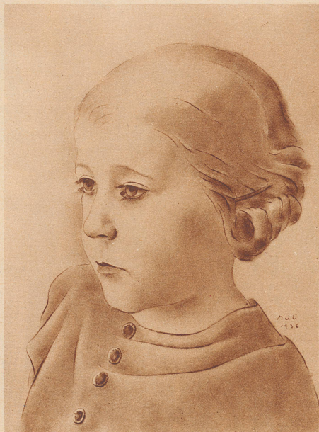
Poucette — Poucette