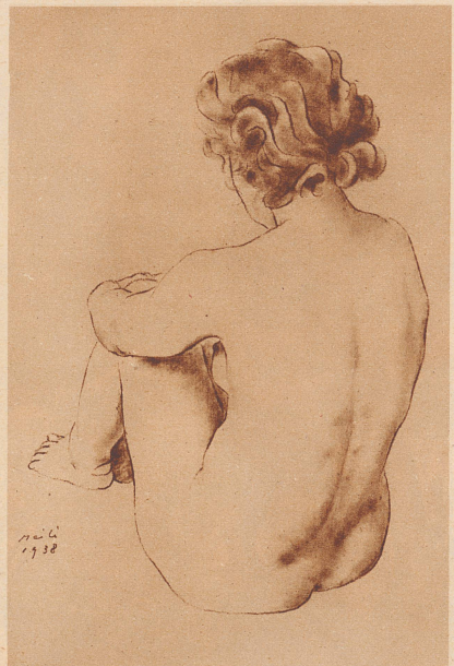
Weibliche Gestalt — Nu