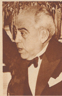
Antonio Fabra Ribas

der bisherige Gesandte der legalen spanischen Regierung in Bern.