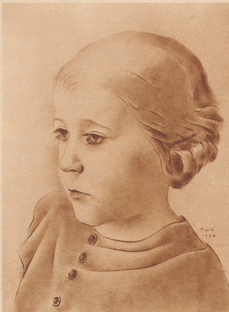
Poucette — Poucette