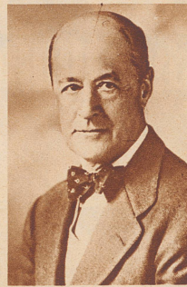
Domenico della Barcenaa

der offizielle Vertreter der Franco-Regierung bei der Eidgenossenschaft.