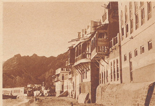
Die Khoja-Burg. Die offenen Balkone der Burg dürfen nur von Männern betreten werden. Die Frauen aber, deren Gemächer auf dieser Seite der Burg liegen, können das Meer nur durch die Holzgitter erblicken. Die Khoja wären reich genug, sich Paläste zu erbauen, aber es ist kein Platz vorhanden. Mattrah, zwischen Bergen eingekeilt, umfaßt so eng die indische Siedlung, daß diese keine Möglichkeit zur Ausdehnung hat. Die Häuser links von der Burg sind Bauten des arabischen Stadtteils.

Au milieu de Mattrah, petit port de la côte arabe où vont et viennent Bédouins, marins, marchands d'Orient, vit une petite communauté ethnographique distincte de son entourage: les Khoja. Les hommes se mêlent librement à la vie active de la ville; personne cependant ne se vanterait d'en avoir jamais vu une femme. L'interprétation par trop rigoureuse des lois du Coran leur interdit toute sortie. Prisonnières solitaires, derrière un haut mur d'enceinte qui les voit naître et mourir, resserrées dans leurs maisons peu spacieuses, elles mènent une existence sans joie et sans lumière.