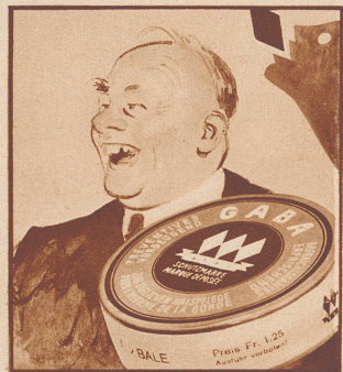
Der Tabak macht die Kehle rau, — Nimm Gaba, spricht die kluge Frau!