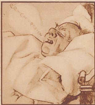
Aber der Tabakduft, den er mitbringt und das Huseln und Krächzen in der Nacht — das ist ihr schrecklich.