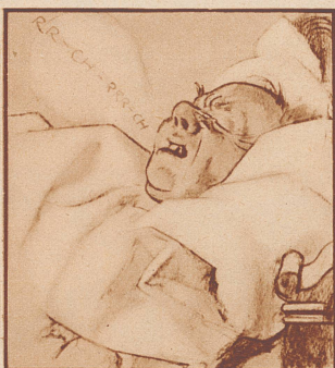
Aber der Tabakduft, den er mitbringt und das Huslen und Krächzen in der Nacht — das ist ihr schrecklich.