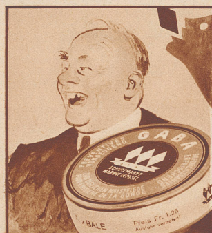
Der Tabak macht die Kehle rau, — Nimm Gaba, spricht die kluge Frau!