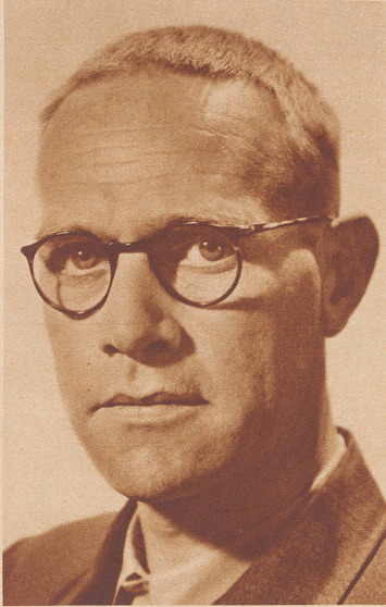
Dr. Georg Schmidt

der neugewählte Konservator des Kunstmuseums Basel.