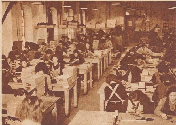
Ein Blick in den Spritz- und Montagesaal des Plastic-Verschlusses. Les fermetures-éclairés de diverses couleurs dites «fermetures riri plastic» sont montées et colorées dans cette vaste salle.