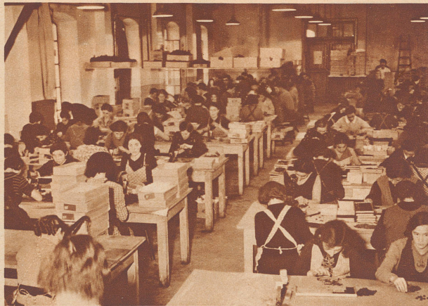
Ein Blick in den Spritz- und Montagesaal des Plastic-Verschlusses. Les fermetures-éclaircs de diverses couleurs dites «fermetures riri plastic» sont montées et colorées dans cette vaste salle.