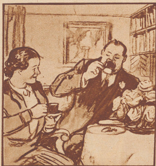
„Jetzt bin ich so weit: von heut an stecke ich das Rauchen auf.“ „Soll ich's glauben?“