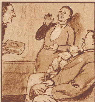
„Oh, oh, eben hat mein Mann dem Rauchen abgeschworen, er wird seiner Raucherkatarrh nicht mehr los.“