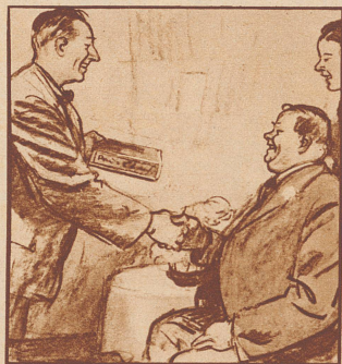
„Ich gratuliere Dir — hier Deine Lieblingsmarke, schwarz und stark.“