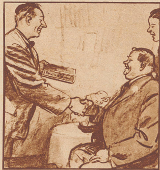
„Ich gratuliere Dir — hier Deine Lieblingsmarke, schwarz und stark.“