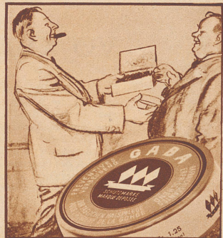
„Ach was! Deshalb gibt man doch das Rauchen noch nicht auf. Dafür gibl's ein Mittel: Gaba-Tabletten.“ Jeder Raucher — Gaba-Verbraucher.