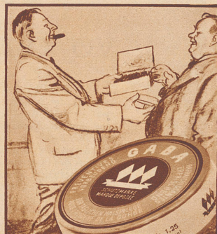
„Ach was! Deshalb gibt man doch das Rauchen noch nicht auf. Dafür gibl's ein Mittel: Gaba-Tabletten.“ Jeder Raucher — Gaba-Verbraucher.