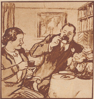
„Jetzt bin ich so weit: von heut an stecke ich das Rauchen auf.“ „Soll ich's glauben?“