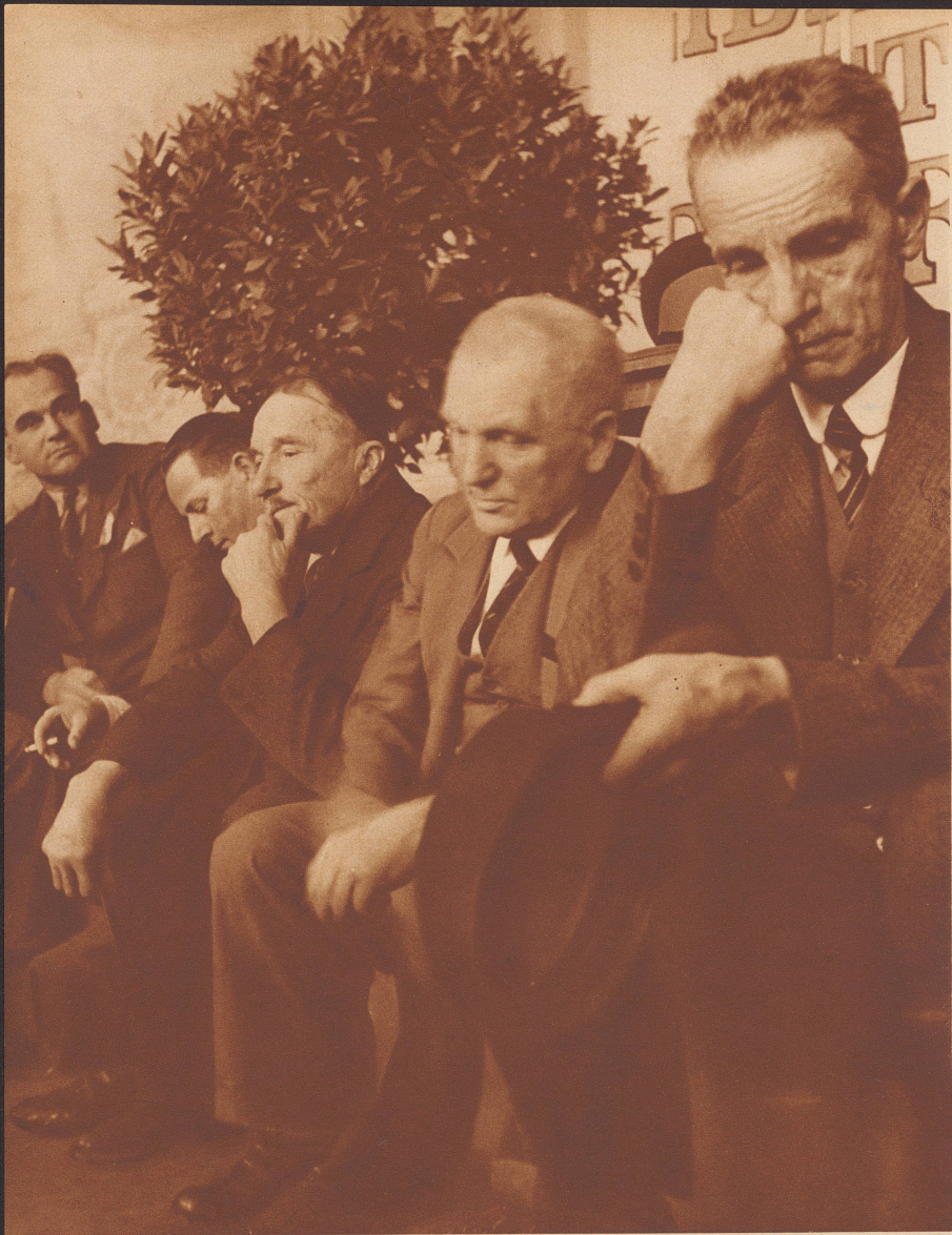
Das Gesicht des welschen Gewerblers und Detailhändlers. Fünf Teilnehmer der Protestversammlung von Vevey.

Cinq participants à la réunion de Vevey.