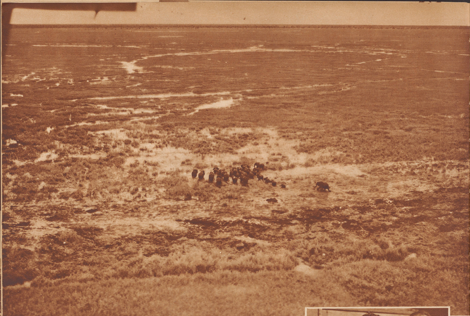
Elefantenherde auf der Weide in der Niambarasteppe im südlichen Sudan. Troupeau d'éléphants dans les marécages des plaines du Niambara (Soudan).