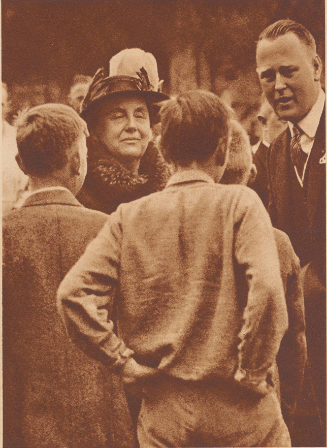
Die populärste Frau des Landes, die Königin, bei einem Sportfest inmitten der holländischen Jugend.

Née le 31 août 1880, la Reine Wilhelmine succédait en 1898 à son père Guillaume III. Le 7 février 1901, elle épousait le Grand Duc Henri de Mecklenbourg.