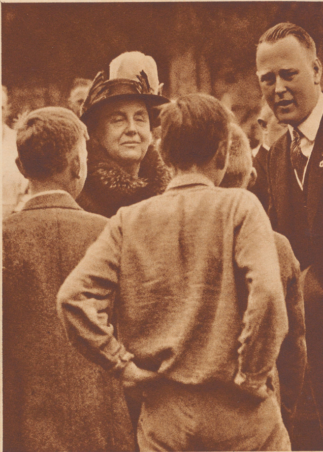
Die populärste Frau des Landes, die Königin, bei einem Sportfest inmitten der holländischen Jugend.

Née le 31 août 1880, la Reine Wilhelmine succédait en 1898 à son père Guillaume III. Le 7 février 1901, elle épousait le Grand Duc Henri de Mecklembourg.