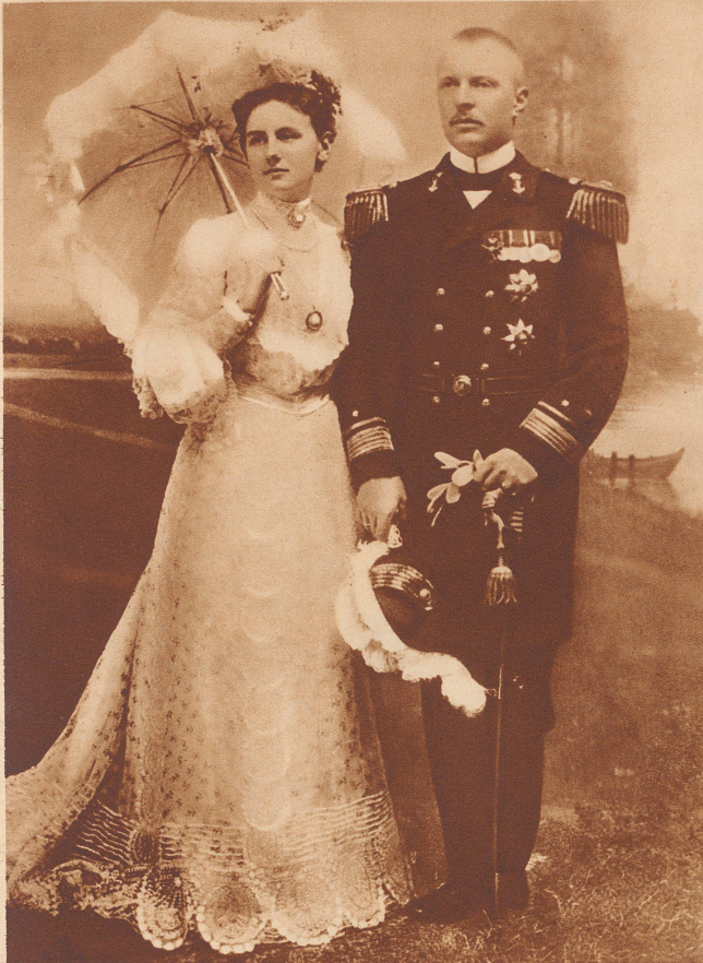
Als Tochter und Nachfolgerin König Wilhelms III. bestieg Wilhelmina am 31. August 1898 den Thron. Am 7. Februar 1901 heiratete sie den Herzog Heinrich von Mecklenburg. Bild: Königin Wilhelmina und der Prinzgemahl kurze Zeit nach der Vermählung.

Née le 31 août 1880, la Reine Wilhelmine succédait en 1898 à son père Guillaume III. Le 7 février 1901, elle épousait le Grand Duc Henri de Mecklenbourg.