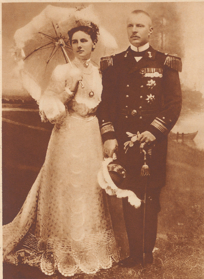
Als Tochter und Nachfolgerin König Wilhelms III. bestieg Wilhelmina am 31. August 1898 den Thron. Am 7. Februar 1901 heiratete sie den Herzog Heinrich von Mecklenburg. Bild: Königin Wilhelmina und der Prinzgemahl kurze Zeit nach der Vermählung.

Née le 31 août 1880, la Reine Wilhelmine succédait en 1898 à son père Guillaume III. Le 7 février 1901, elle épousait le Grand Duc Henri de Mecklembourg.