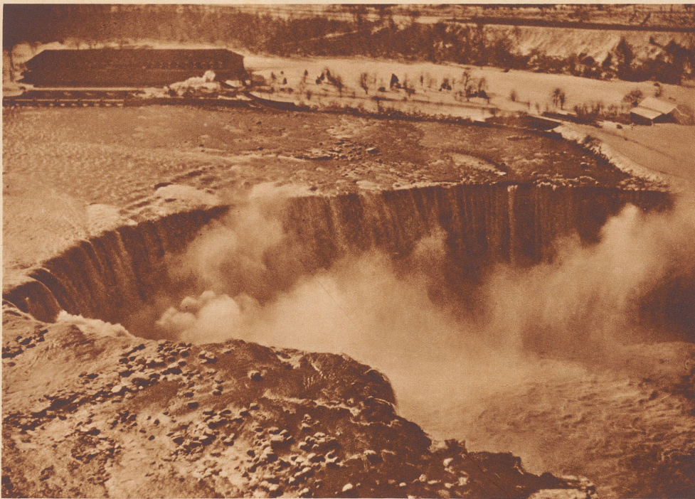
Flugaufnahme von den Niagarafällen.

Contraste. L'eau est rare dans les villes de Palestine. Les municipalités procèdent chaque semaine à une distribution. Entre temps, les robinets sont enfermés dans de véritables cages blindées.