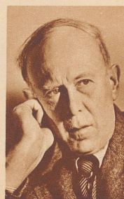
Musikdirektor Dr. h. c. Brun

Da wird der Buchhalter Pacreau weggetragen, nachdem er von einem Eisbären, den er über die Brüstung des Bassins mit Brot fütterte, angefallen und schwer verletzt wurde. Curieux accident. Un comptable parisien qui lançait du pain aux ours blancs du Zoo est atteint et blessé par l'un des plantigrades. On le transporte d'urgence à l'infirmerie.