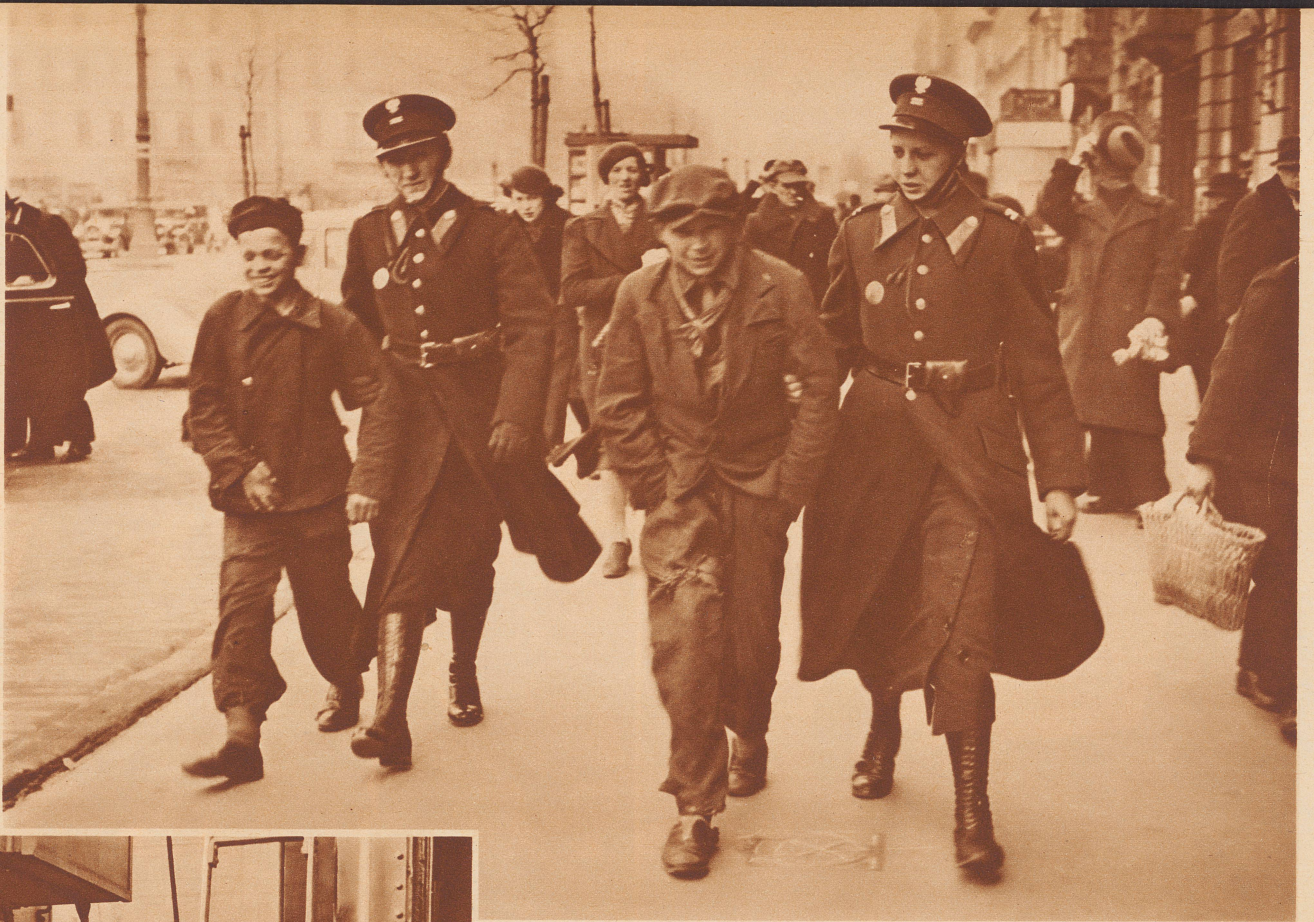
Zwei jugendliche Vagabunde werden von Polizistinnen aufgegriffen und in den Polizeihort gebracht. «Faits» et par des agentes encore! Ces deux gamins ont l'air de trouver fort plaisante leur mésaventure.