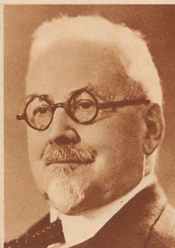
† Dr. Charles E. Guillaume

Adolf Schlatter, de St-Gall, depuis 1898 professeur de théologie à l'Université de Tübingen, est décédé à l'âge de 86 ans.