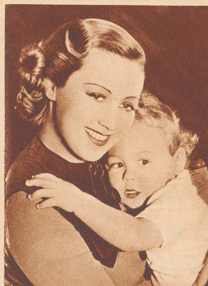
Joan Blondell and her Son Warner Brothers Star appearing in "The Perfect Specimen"

IRIUM gibt Ihren Zähnen wieder strahlenden Glanz