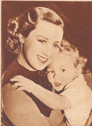
Joan Blondell and her Son Warner Brothers Star appearing in "The Perfect Specimen"

27... Kh7×g7, 28. Sd4—e6+! Schwarz gab auf. Es würde folgen: Kg8, S×f8, K×S, Te6! (Droht D×f5+), Dd7, D×f5+, Df7, D×d5, Tb8, Dd4! Dg7 (Kg8? T×h6!), Df4+, Kg8, Df5! (Droht Tg6 mit Damengewinn), Ld7? Te8+, L×T, T×L+ nebst Matt. Ein fein durchdachtes Schlußspiel des Siegers.