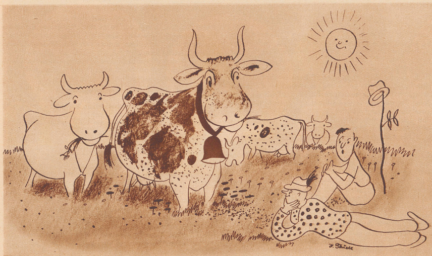
Zeichnung H. Thiele

«86 Kühe sind hier auf der Weide.» «Wie hast du denn das so rasch herausbekommen?» «Ganz einfach, ich habe die Beine gezählt und dann durch vier dividiert!!» — Il y a 86 vaches dans ce pâturage? — Comment es-tu parvenu à le dénombrer aussi rapidement? — Très simple, j'ai compté le nombre de pattes et je l'ai divisé par 4!!