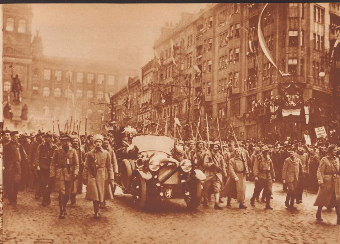
28. Oktober 1918. Die Republik ist ausgerufen. Ihr Gründer und erster Präsident, Masaryk, zieht in Prag ein. Begleitet von Vertretern der Sokols, der Legionen in Rußland, Frankreich und Italien und bejubelt von der Bevölkerung, fährt er zum Hradschin. Octobre 1918. La République est proclamée. Entourée des délégués des Sokols, des légions combattant en France, en Russie, en Italie, la voiture du Président Masaryk se dirige vers le Hradschin.