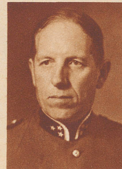
Oberst Hans Frick

bisher 1. Sektionschef bei der Generalstabsabteilung, wurde zum Unterstabchef der Armee ernannt.