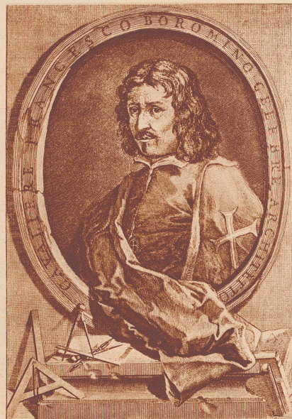
Francesco Borromini (1599–1667), stammte aus einer Künstlerfamilie. Der eigenartigste Architekt des Barock, Erbauer vieler Paläste und Kirchen.

Arbeit als stuccatore zuwies. Carlo Maderno war immer vom Glück begleitet. Dazu half ihm sein ausgeglichener, großmütiger Charakter. Der Bau von San Sanna zog die allgemeine Aufmerksamkeit nach sich, und bei der Ausschreibung für den Neubau von St. Peter fiel die Wahl auf ihn. In seinem 47. Jahre wurde ihm der Titel eines Bauleiters von St. Peter zuteil. In seinen großen Entwürfen lehnte er sich an Michelangelo an, der ihm das unerreichte Vorbild war. Der Baugedanke Michelangelos mußte indessen aus verschiedenen sach-