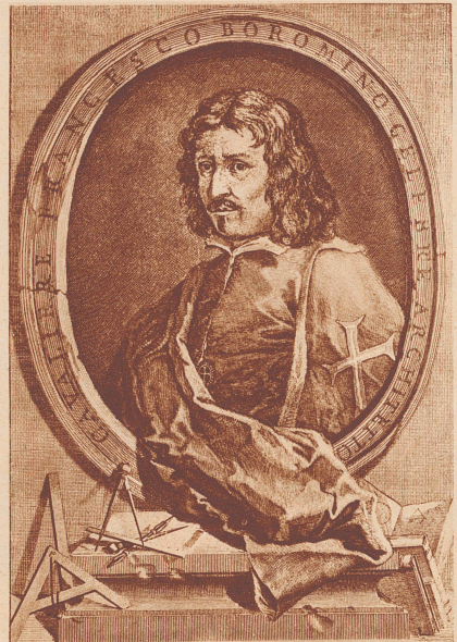
Francesco Borromini (1599–1667), stammte aus einer Künstlerfamilie. Der eigenartigste Architekt des Barock, Erbauer vieler Paläste und Kirchen.

Arbeit als stuccatore zuwies. Carlo Maderno war immer vom Glück begleitet. Dazu half ihm sein ausgeglichener, großmütiger Charakter. Der Bau von San Sanna zog die allgemeine Aufmerksamkeit nach sich, und bei der Ausschreibung für den Neubau von St. Peter fiel die Wahl auf ihn. In seinem 47. Jahre wurde ihm der Titel eines Bauleiters von St. Peter zuteil. In seinen großen Entwürfen lehnte er sich an Michelangelo an, der ihm das unerreichte Vorbild war. Der Bagedanke Michelangelos mußte indessen aus verschiedenen sach-