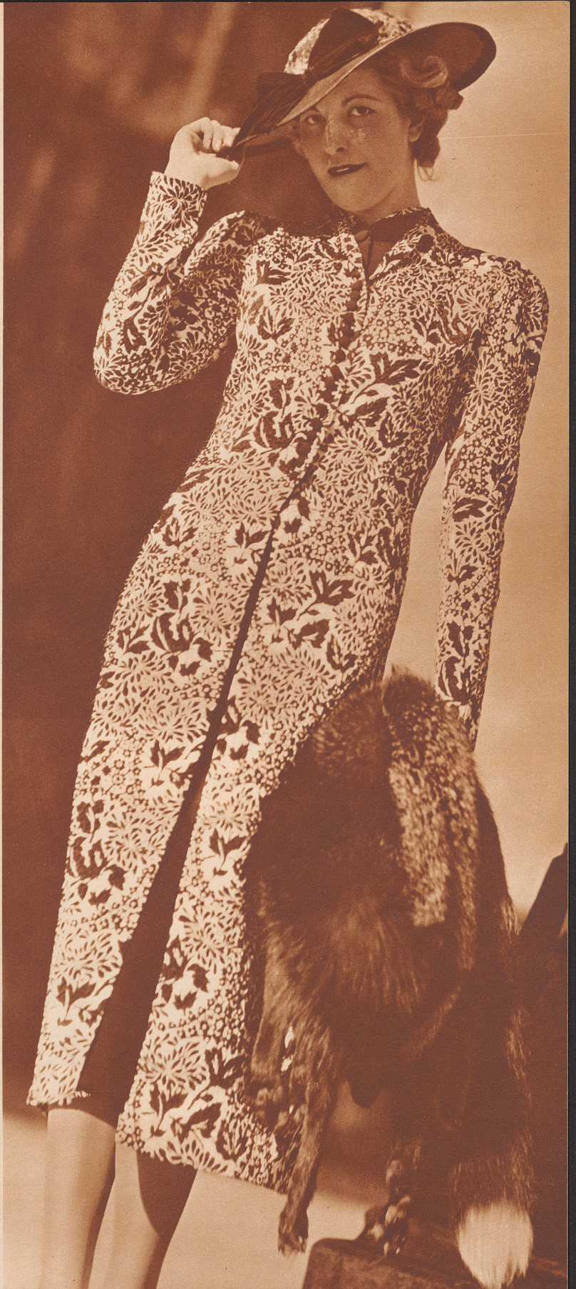
Nachmittagsmantel aus schwarz-weißem Cloquésatin, getragen über einem schwarzen Romainkleid. Modell: Farnhammer, Wien. Manteau d'après-midi en satin cloqué noir et blanc, porté sur une robe de crêpe romain noir.