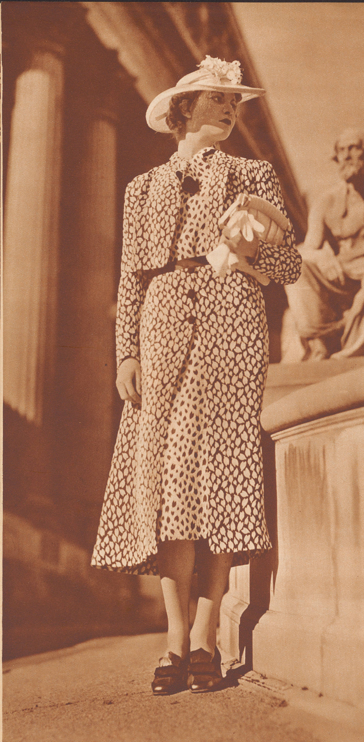
Cloqué-Bolero-mantel und Cloqué-Kleid mit rotem Satingürtel. Modell: Farnhammer, Wien. Manteau-boléro en cloqué et robe de cloqué avec ceinture de satin rouge.