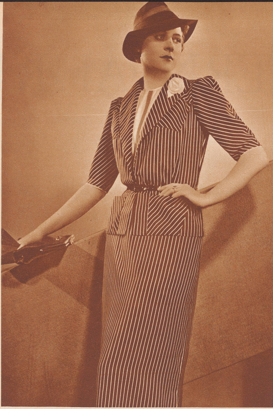
Elegantes Deux-pièces aus Surah-Seide. Modell: Jelmoli, Zürich. Élégant deux-pièces en surah.