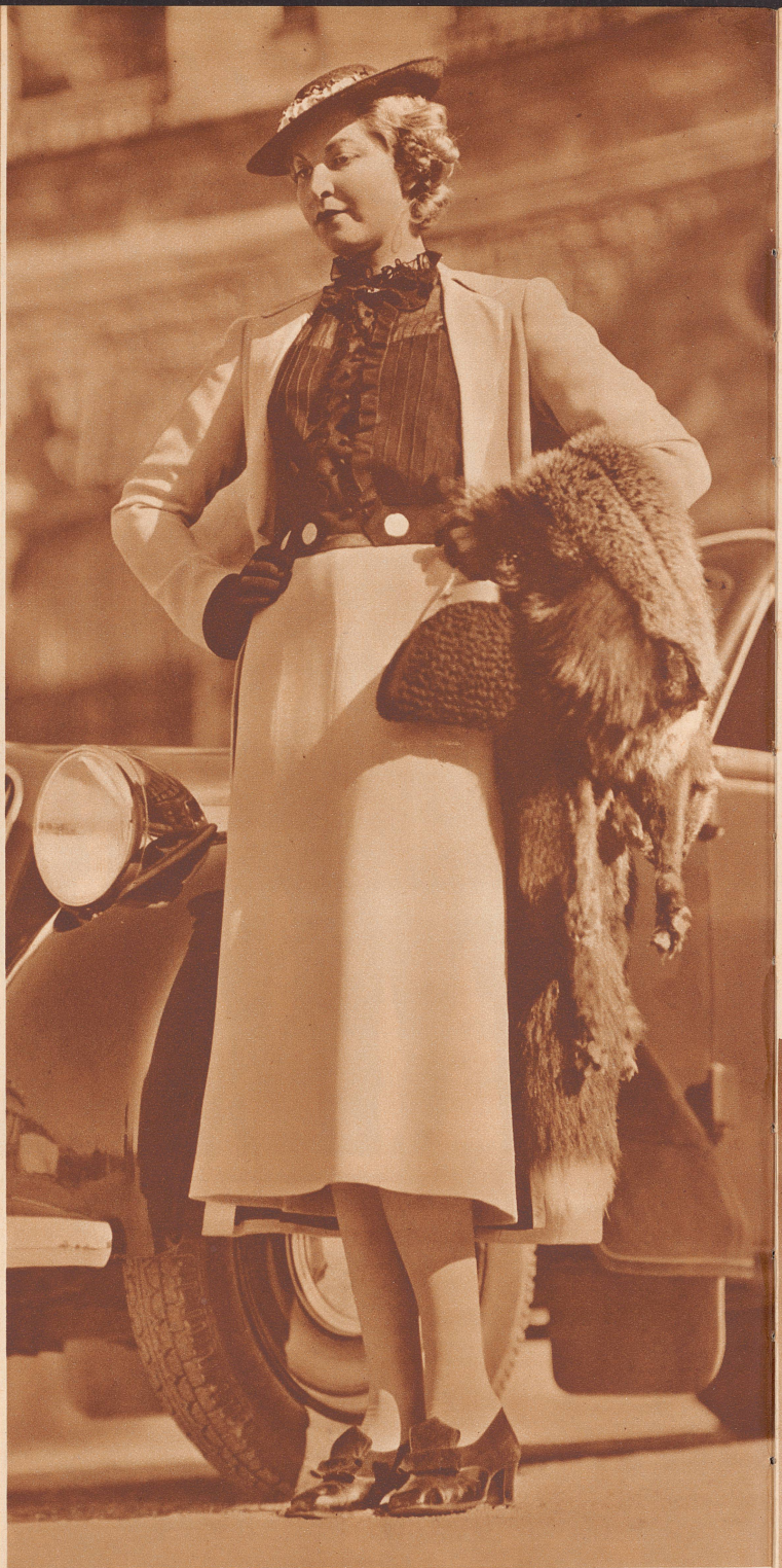
Türkisfarbenes Crêpe de Laine-Complet mit schwarzer Tüllbluse. Modell: Farnhammer, Wien. Tailleur en crêpe de laine turquoise avec blouse de tulle noir.