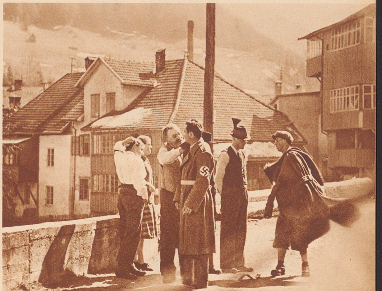
Einkleidung in die neue Partei-Uniform — es ist gut, daß ein Erfahrener dabei ist, der zeigen kann, wie das richtig gemacht wird. (Aufnahme aus Steinach, einem kleinen Ort am Brenner).