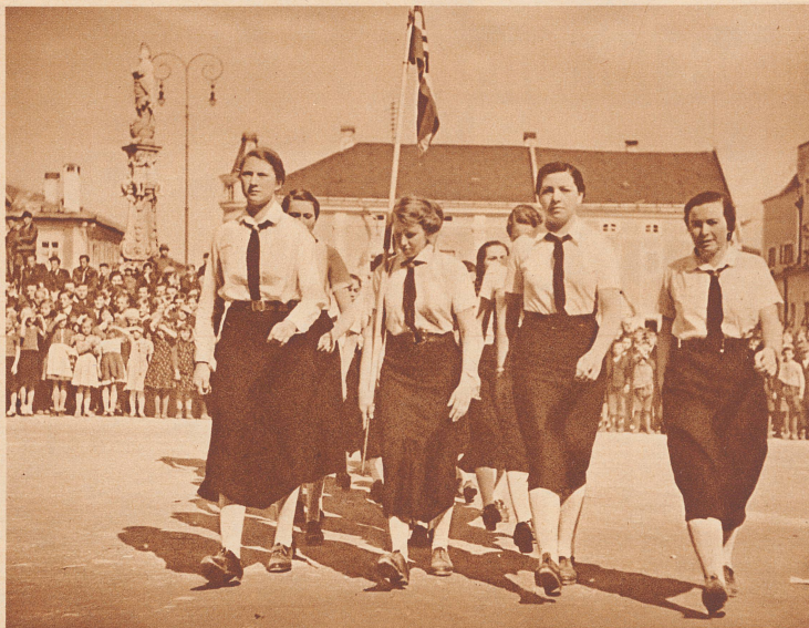
... eines Werbemarsches der Hitler-Mädchen («B. d. M.») von Linz. ... au défilé des jeunes hitlériennes de Linz.