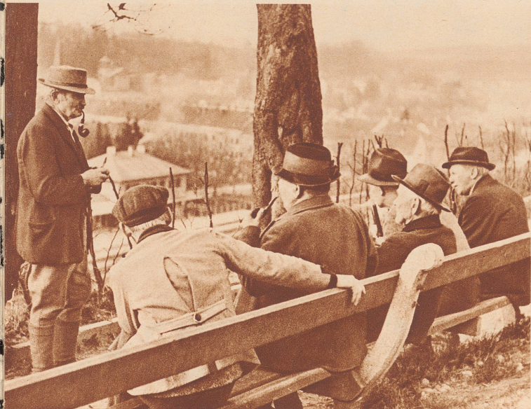
Arbeitslose in der Industriestadt Steyr: wer Weltgeschichte miterlebt, hat es oft schwer, sich zurechtzufinden. Eine kleine Diskussion kann da nur nützlich sein.