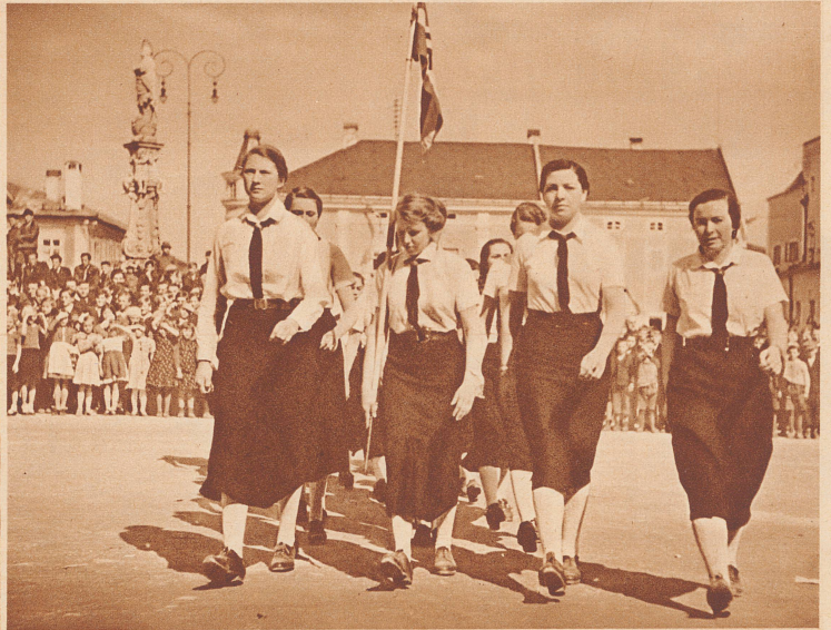
... eines Werbemarsches der Hitler-Mädchen («B. d. M.») von Linz. ... au défilé des jeunes hitlériennes de Linz.