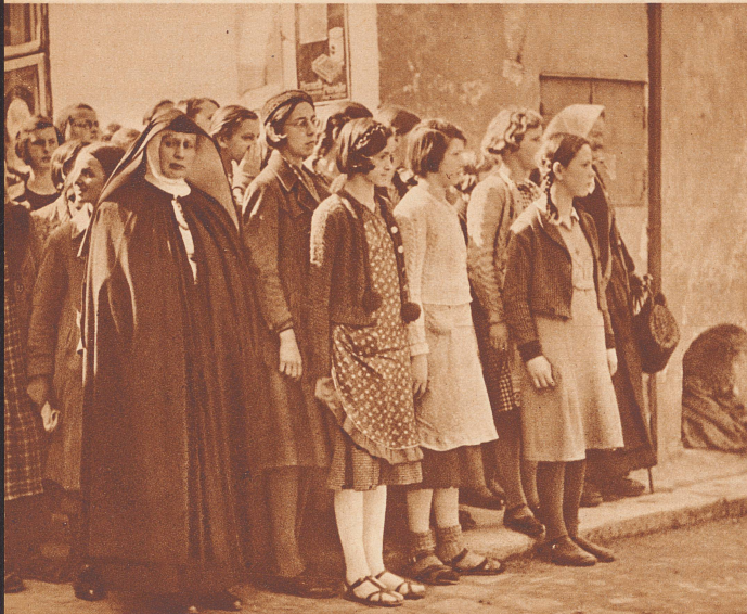
Schülerinnen einer öffentlichen Lehranstalt in Freistadt (Ober-Oesterreich), unter Aufsicht ihrer geistlichen Lehrerin, als Zuschauer ... Sous le regard de leur directrice spirituelle, elles assistent ...