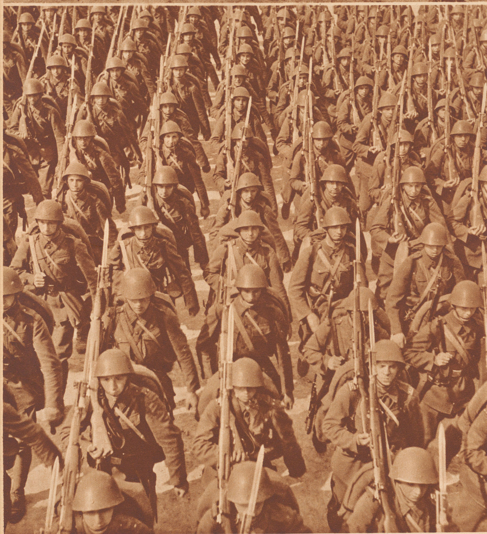
Tschechoslowakische Infanterie auf dem Marsch. — Infanterie tchécoslovaque en marche.