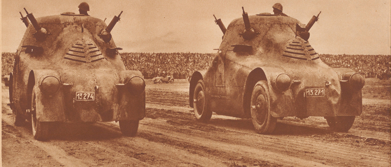
Tschechoslowakische Panzerwagen bei einer Parade in Prag. Chars d'assaut dans une parade de Prague.