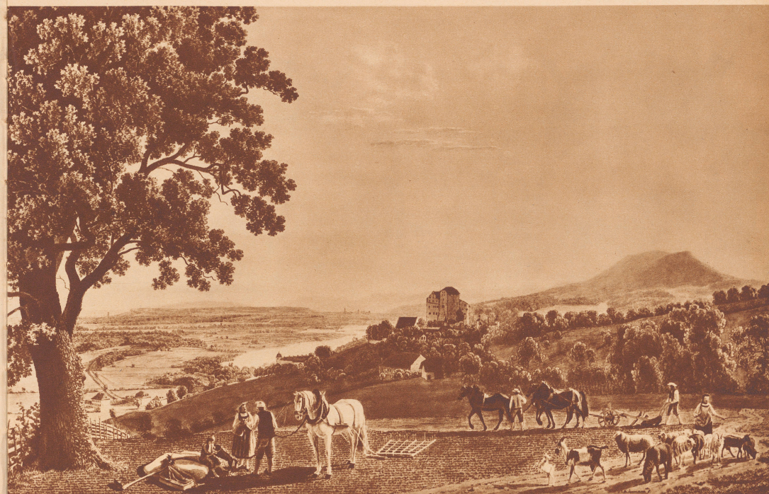
Blick auf Schloß Wildegg und die Aarelandschaft (Stich). — Le château de Wildegg et la campagne argovienne (gravure).