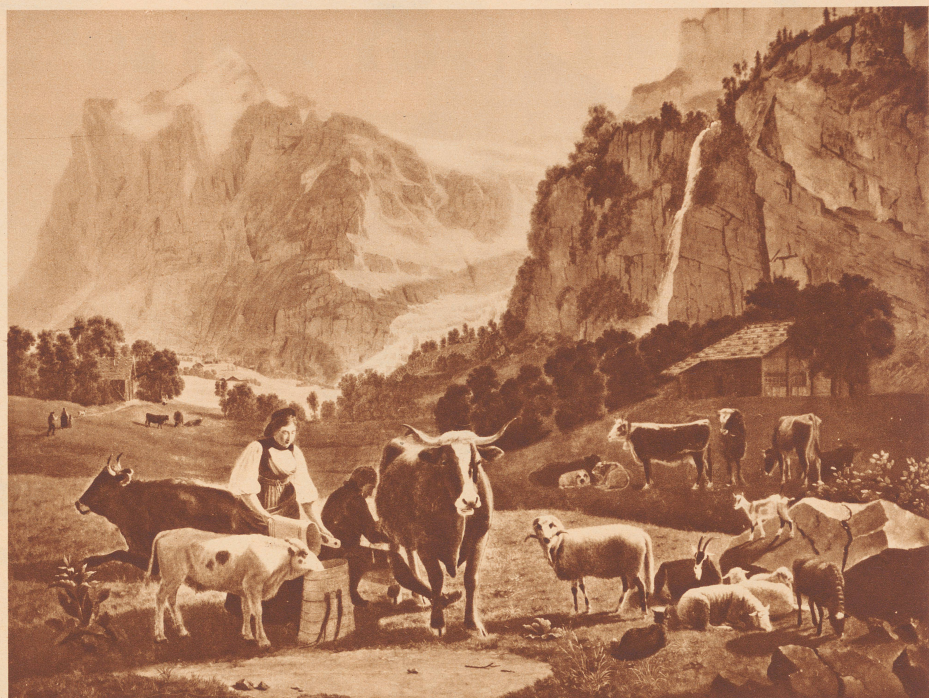
Grindelwaldal mit Wetterhorn (1817). — Grindelwald et le Wetterhorn (1817).