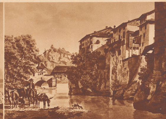
Motiv aus Lausanne, 1784 (Aquarell). Aquarelle romantique (1784).