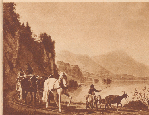
Landschaft am Lowerzersee. — Au bord du lac de Lowerz.

Le Musée des Beaux-Arts de Lucerne expose actuellement les œuvres du peintre Johann-Jakob Biedermann. Paysages d'idylle... on imagine Byron ou Dumas s'arrêtant au pied d'une paroi rocheuse, admirant une cascade, prenant la diligence. Le progrès a passé. Que reste-t-il de cette Suisse d'estampes et de bergeries?